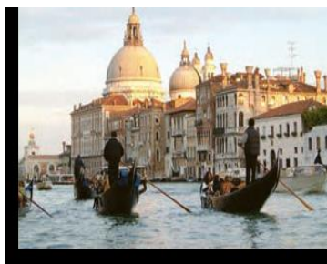
ونیز در ایتالیا

۲. حدس بزنید عکسهای شماره ۳ و ۴ کدام مکان های گردشگری در اروپا را نشان می دهد؟