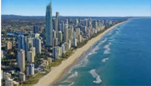
ساحل اقیانوس آرام، کویئزلند، استرالیا

متن سوال تصور کنید نسبت خشکی ها و اقیانوسها برابر می شد . اگر این اتفاق رخ می داد . پیش بینی شما از این وضعیت چه خواهد بود ؟ و راهکار شما برای ان چیست ؟