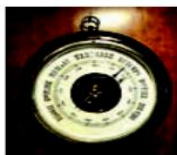
فشارسنج جیوه ای

2: بتواند با فشار سنج جیوه ای هوای کلاس خود را اندازه گیری کند.